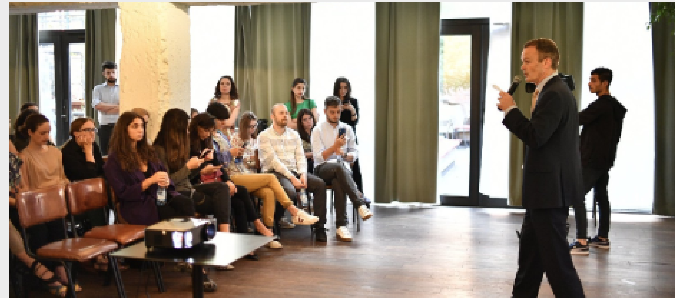
ივლისში კი სტუმარმასპინძლობის სფეროს შესახებ Les Roches უნივერსიტეტის ქართველმა სტუდენტებმა და კურსდამთავრებულებმა ყვარლის ტბის კურორტის თანამშრომლებს სემინარი თავად ჩაუტარეს.

მსოფლიოს საუკეთესო სამეულის წევრი შვეიცარული სკოლა, ტურიზმისა და სტუმარ-მასპინძლობის მიმართულებით, Les Roches ტურიზმის ეროვნული ადმინისტრაციისა და მსოფლიო ტურიზმის ორგანიზაციის მხარდაჭერით, ბიზნესისა და ტექნოლოგიების უნივერსიტეტის ბაზაზე ფუნქციონირებს.